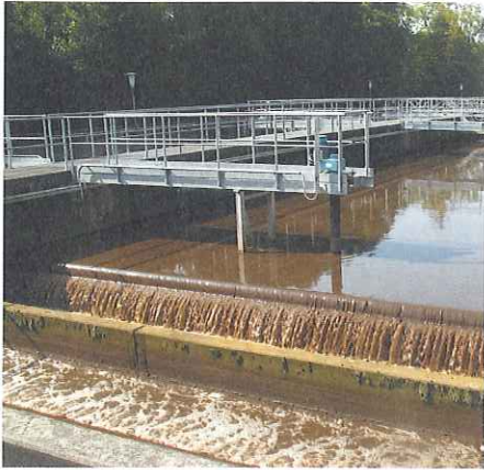
Biologisches Reinigungsbecken der Kläranlage Schönau

So gehören Feststoffe wie Wattestäbchen, Wegwerfwindeln, Kondome, Slipinlagen, Verpackungen, Textilien, Katzenstreu, Zigarettenstummel nicht in die Kanalisation. Diese Dinge gehören in die gebührenpflichtigen Kehrichtsäcke.