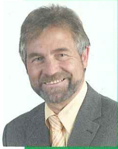
Leitwort unseres Präsidenten